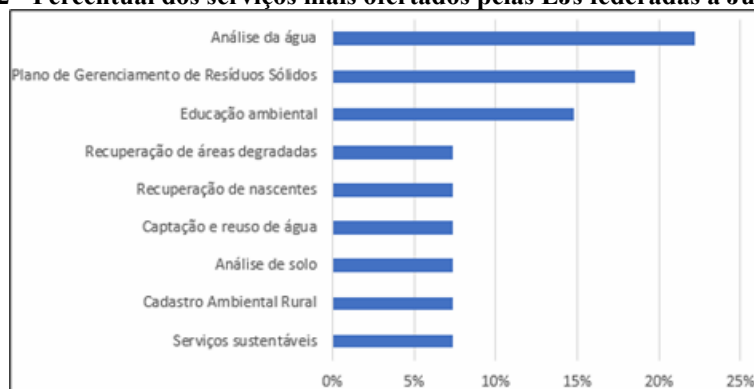
Gráfico 2 - Percentual dos serviços mais ofertados pelas EJs federadas à Juniores/ES.

No Gráfico 2, são apresentados os percentuais dos serviços ambientais mais ofertados pelas EJs federadas à Juniores/ES. Nota-se que, assim como na RioJunior, a análise de água é o serviço mais ofertado, com 22%. O PGRS ocupa a segunda posição, com 19%, seguido pela educação ambiental (15%), enquanto os demais serviços ficaram com 7%.