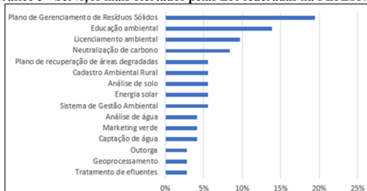
Gráfico 3 - Serviços mais ofertados pelas EJs federadas na FEJESP/SP.

O Gráfico 3 exibe os percentuais dos serviços mais ofertados pelas EJs federadas à FEJESP/SP. Diferentemente das outras federações, o PGRS lidera com 19%, seguido pela educação ambiental (14%) e pelo licenciamento ambiental (10%). Já os serviços com menor oferta incluem outorga, geoprocessamento e tratamento de efluentes, todos com 3%.