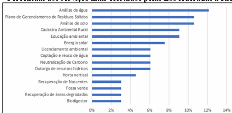
Gráfico 1 – Percentual dos serviços mais ofertados pelas EJs federadas à RioJunior/RJ.

O Gráfico 1 apresenta o percentual dos serviços mais ofertados pelas EJs federadas à RioJunior. Destaca-se a análise de água, com 12%, como o serviço mais ofertado, seguida da análise de solo e Plano de Gerenciamento de Resíduos Sólidos (PGRS), ambos com 11%. Outros serviços, como a educação ambiental e o Cadastro Ambiental Rural (CAR), aparecem com 9%. Em contrapartida, os serviços menos ofertados incluem recuperação de nascentes, fossa verde, recuperação de áreas degradadas e biodigestores, todos com 3%.