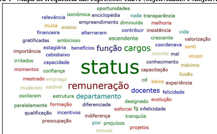
Figura 4 - Mapa de frequência das expressões-chave (objetividades e subjetividades)