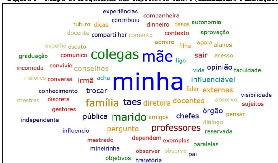
Figura 3 - Mapa de frequência das expressões-chave (dinamismo e mutação)