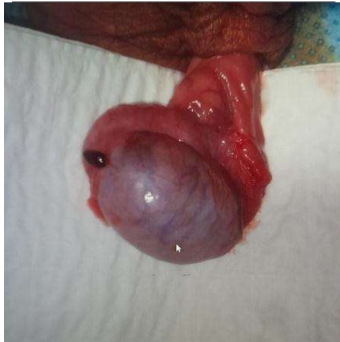
Figure 2: torsion of Morgani Hydatid

Benmassaoud Zineb, et. al. "La torsion du cordon spermatique chez l'enfant: les aspects épidémiologiques, cliniques, radiologiques et thérapeutiques. A propos de 43 cas." IOSR Journal of Dental and Medical Sciences (IOSR-JDMS) , 22(1), 2023, pp. 37-39.