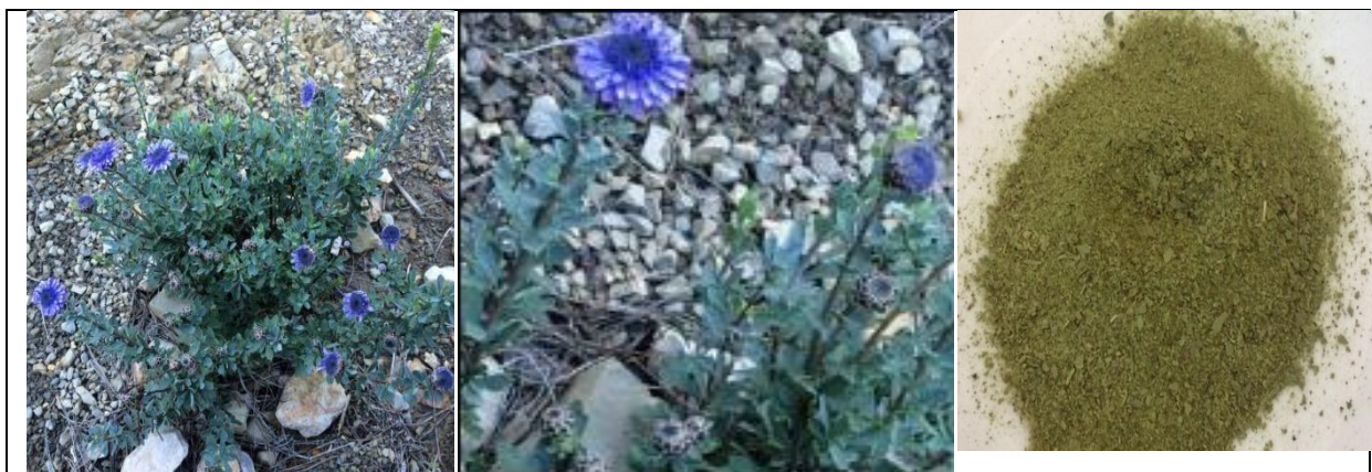
Fig.1. Globularia alypum L