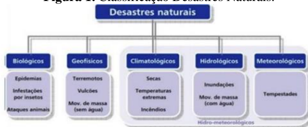
Figura 1. Classificação Desastres Naturais.

Ao analisar criticamente a importância da temática na gestão de crises humanitárias, este trabalho contribui para uma compreensão mais aprofundada dos desafios enfrentados e das melhores práticas empregadas na prestação de assistência humanitária em todo o mundo.